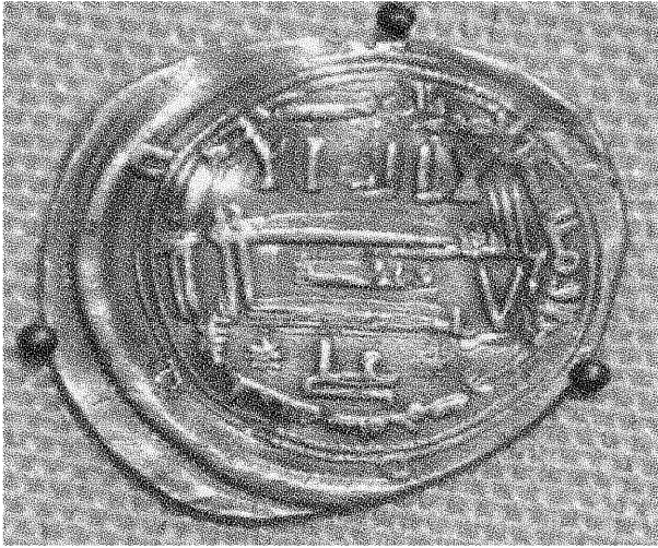
درهم فضي - إدريس الثاني - ضرب ٣٠٢ هـ بالعلية